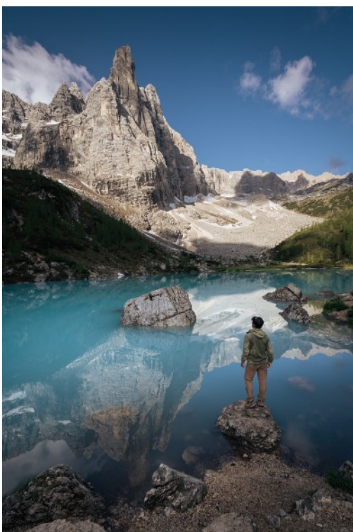
- Lago Sorapis