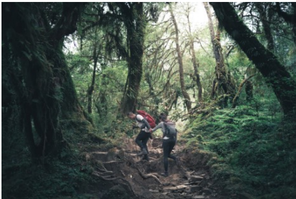
เส้นทางเป็นป่า ร่มรื่น