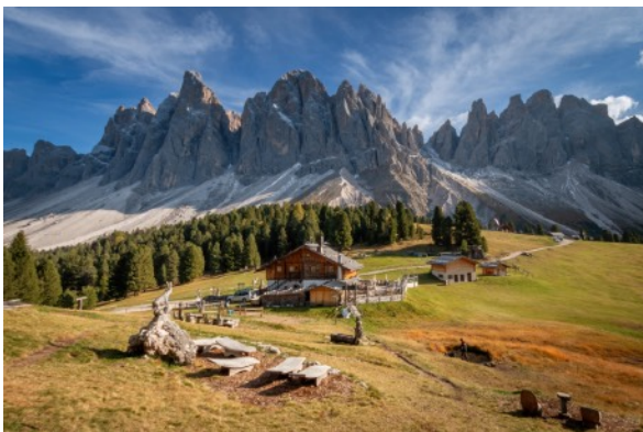
- Rifugio delle Odle