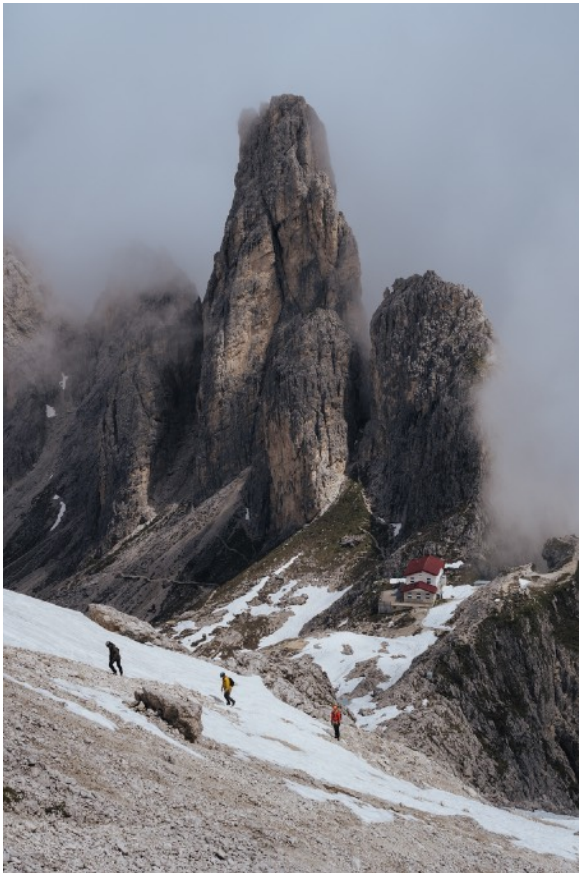
- Rifugio Fonda Savio