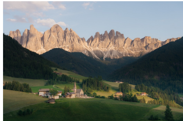
- St. Magdalena